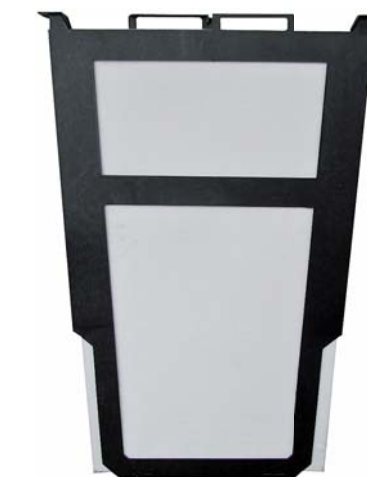
ワンタッチ交換式油吸着マット枠 12枚